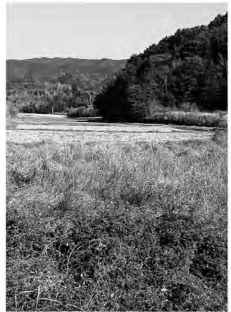
増えつつある耕作放棄地

答 荒廃農地再生生活動を支援する制度はありますが、用途が限られています。地域ぐるみでの農道や水路等の維持管理に努め、