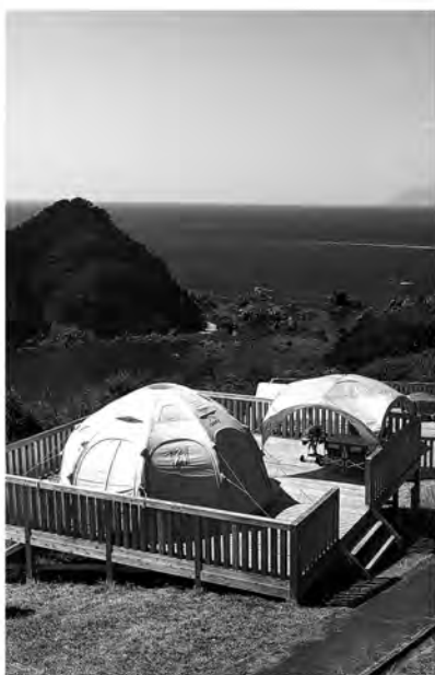
檜西のコットンテント

答 委託先はアウトドアフィールドKASHIISHIの指定管理者である株式会社Founding Base。内容はコットンテント3基を耐久性の高いドーム型テント3基へ再整備する予算です。