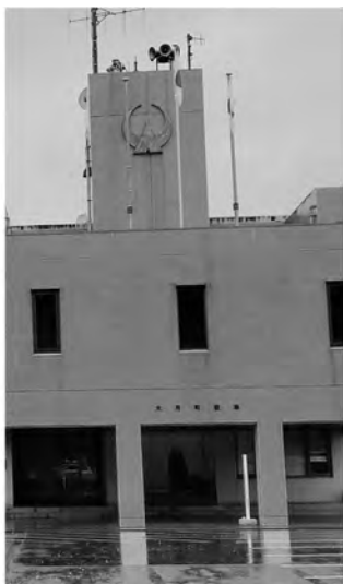
役場は規範が大切

答 危機管理の担当は、町内の在住であることが望ましいと受けとめています。私が人事をするわけです。やはり適材適所、町内町外問わずに私は配置をする予定です。また、旅行は事実です。危機管理上、初動対応の強化、即応体制の強化を図るため、危機管理参集要件を規定化するなど、仕組み、ルー化、見える化を行う必要もあると考えています。