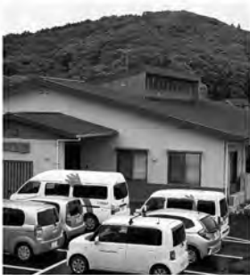
デイサービスさんご