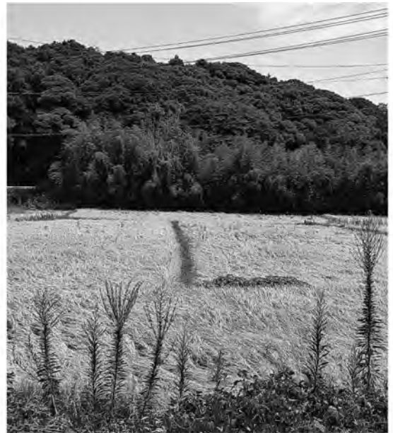
農業を続けられる施策を