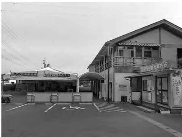
住民の願いに応える道の駅計画を

道の駅再整備事業 基本設計委託料900万円 町は、道の駅をリニューアルするための「基本設計」委託予算900万円を計上した。 一次産業の振興、食堂の設置など住民の願いに応える道の駅の計画を期待したい。