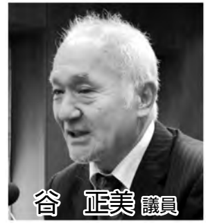
谷 正美 議員

問 後継者不足、高齢化が進む中、農業従事者をどのような施策をもって守っていくのか、持続可能な農業施策において具体的な取り組みを聞く。