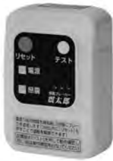
感震ブレーカー・コンセントタイプ

緊急性の高い事業から優先的に予算化しており、財政的な面からも全戸配布は難しいと考えています。引き続き、県の補助事業を活用しながら普及に努めていきたいと思っています。