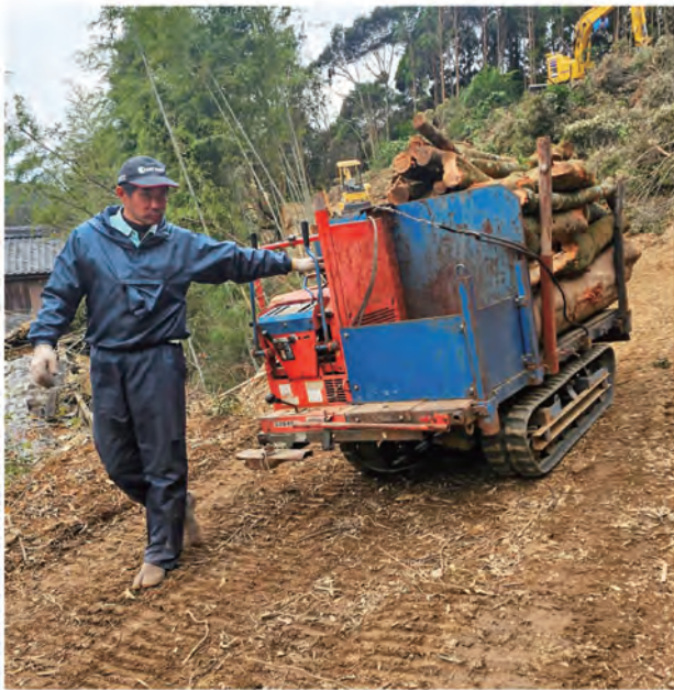
自走式運搬機を使い、木材を運び出す