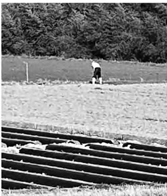
高齢化が進む農業従事者

答 農業を職業として選べる環境作り、効率的な農業経営を可能にする圃場整備や組織作りなど、農業を持続可能な産業として成り立たせる仕組み作りが重要です。アンテナショップの活用協定、ふるさと納税の実績ある企業との契約協議など、売れる農作物、稼げる農業を目指し、民間活力を活用しながら、さらに販路拡大に向けて模索していきます。