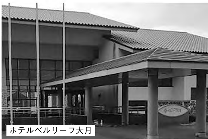
ホテルベルリーフ大月

以上の点から、本計画は一度白紙に戻し、より専門性のある事業者の公募、あるいは計画の抜本的な見直しを強く求めます。