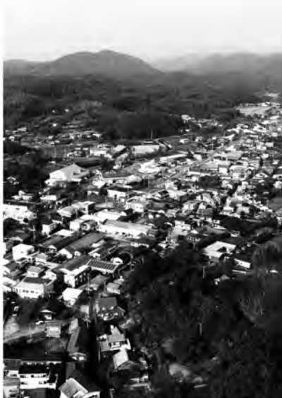
限りある予算を大切に

変化や成果につきましては、単年で実感できる即効性の高い施策と、持続的効果や、中長期的効果により成果が出る施策など、一様ではありませんが、徐々に成果が表れるものと考えています。