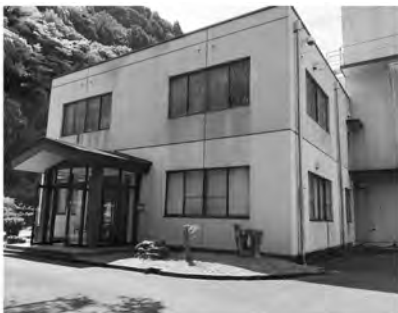
幡西衛生処理センター