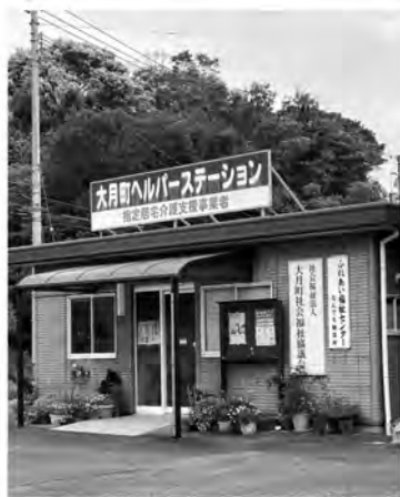
早期の経営改善を

令和7年度は運営赤字相当分を増額しています。人件費や各種受託事業の不足分について自主財源から捻出しましたが、介護保険事業運営が厳